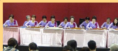
タすげの会(大正琴)