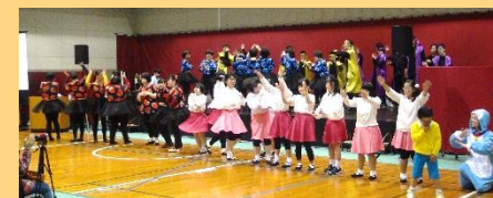
バタフライ(ダンス)