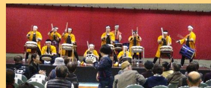
長崎一心太鼓(和太鼓)