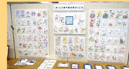
あったか絵手紙教室 ぴっころ

今年もたくさんの団体にご参加いただきました。ありがとうございました！ 来年もよろしくお祈いします。