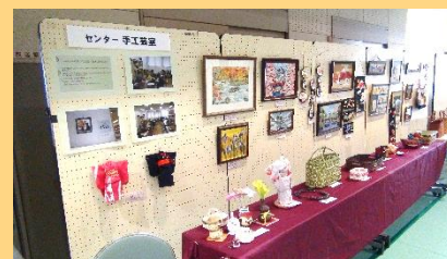
ハートセンター手工芸室 (手工芸)